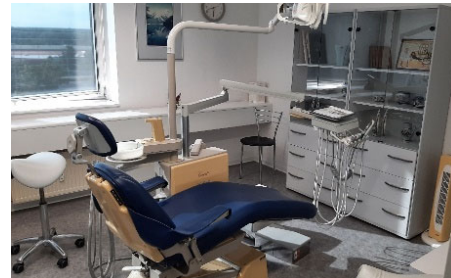
Blick in die Praxis: Wartebereich und Behandlungszimmer