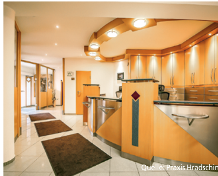
Rezeptionsbereich und ein Sprechzimmer der Praxis Hradschin

Sie finden bei uns die Möglichkeit, vom ersten Tag an treue und liebe Patienten mit einem kompetenten und