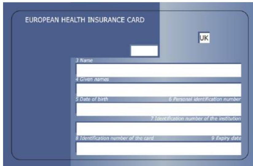
Vorderseite Vereinigtes Königreich