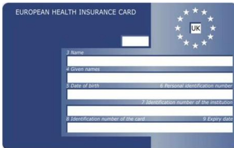
Vorderseite Königreich – England – Schottland