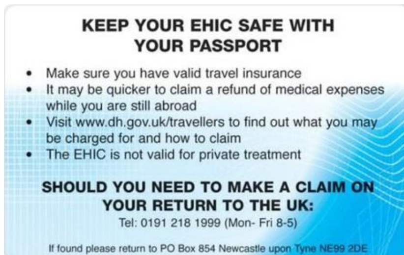
Rückseite Vereinigtes Königreich – England – Schottland