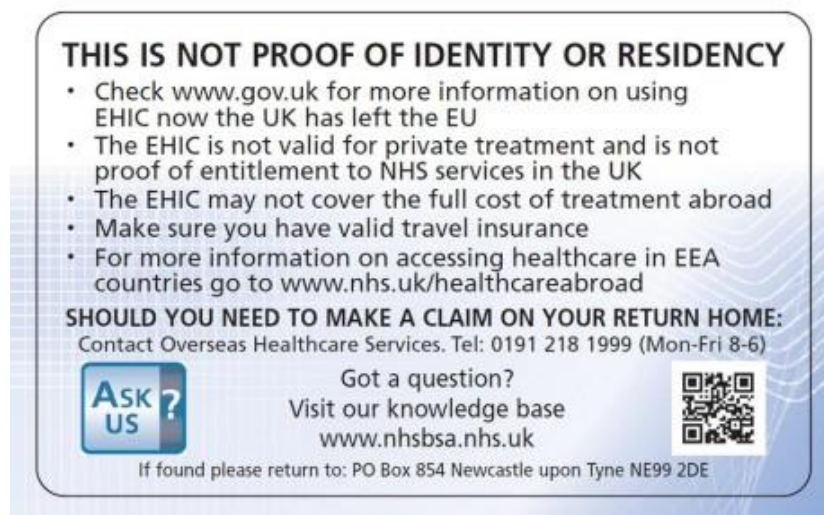
Rückseite Vereinigtes Königreich

Britische EHICs im alten Design mit und ohne EU-Logo bleiben weiterhin bis zu ihrem Ablaufdatum gültig. Sie werden bei Neuanträgen durch die Global Health Insurance Card (GHIC) ersetzt.