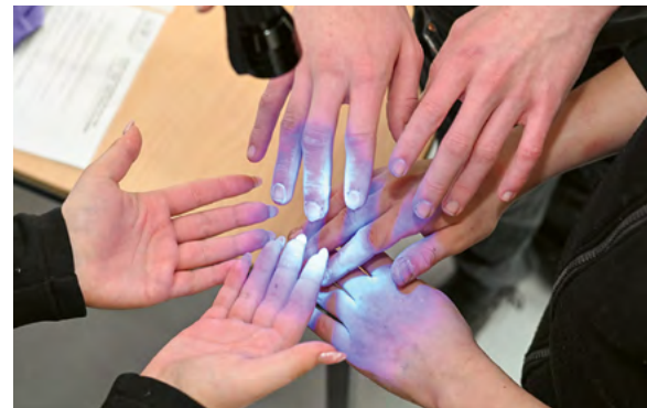
Nicht nur sauber, sondern rein – die Lampe zeigt's: Händedesinfektion will gelernt sein