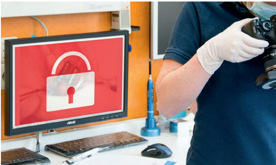
Sicherheitsbewusster Umgang mit Daten von Patienten und aus dem Praxisbetrieb bedeutet Sicherheit für alle Beteiligten

Einen angemessenen Sicherheitsstandard bei der elektronischen Datenverarbeitung in der Zahnarztpraxis einzuführen und konsequent zu praktizieren, ist angesichts der stetig steigenden Komplexität der Anwendungen nicht immer einfach 1 .